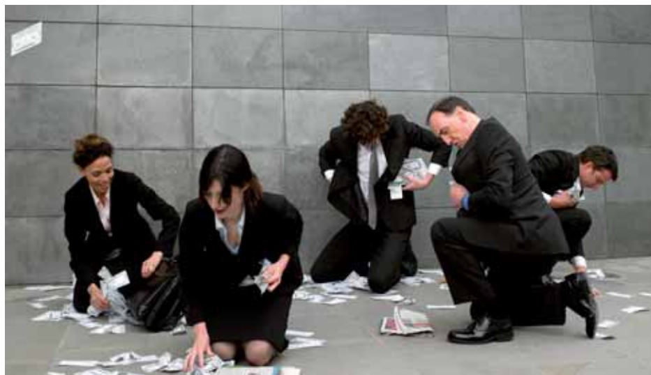
Jeder siebte Geringverdiener gibt als Freizeitaktivität „zusätzliches Geld verdienen“ an.

Nachbarschaftshilfe. Im Freundeskreis trifft man sich häufiger privat, man hilft sich gegenseitig vermehrt handwerklich und es werden auch mehr neue Freundschaften geschlossen. Selbst in einigen sportlichen Bereichen sind die Geringverdienenden häufiger aktiv: Sie fahren mehr Rad, gehen öfter wandern und tun häufiger